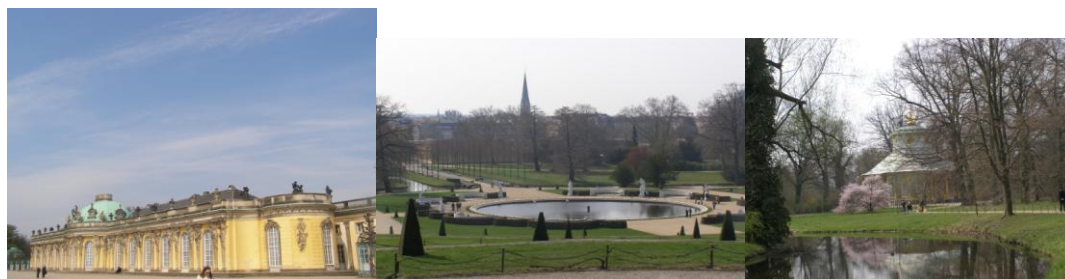
Poczdam: Pałac Sanssouci i okolice.

Wilhelma oraz wstąpiliśmy do centrum handlowego KaDeWe. Zobaczyliśmy słynny Bahnhof Zoo znany z książki "Dzieci z dworca Zoo". Mieliśmy również chwilę dla siebie, kiedy to, chcąc cokolwiek kupić, mogliśmy popisać się naszą znajomością języka niemieckiego, co czasami wychodziło może nie najpoprawniej, ale na pewno dawało nam dużo powodów do śmiechu :) Udaliśmy się w końcu na mierzącą w sumie 368m Wieżę Telewizyjną. Wrażenia były niesamowite! W kilka sekund pokonaliśmy windą przeszło 200m. W zasięgu wzroku mieliśmy cały Berlin. Następnie pojechaliśmy autokarem do ośrodka na obiadokolację, by niedługo po niej znów wyruszyć na wieczorny spacer po Berlinie. Mimo, że nie udało nam się wejść do Reichstagu, to wieczór był bardzo udany. Przeszliśmy na Pariser Platz, by ostatni raz zrobić sobie pamiątkowe zdjęcia przy Bramie Brandenburskiej. Późnym wieczorem udaliśmy się do hotelu.