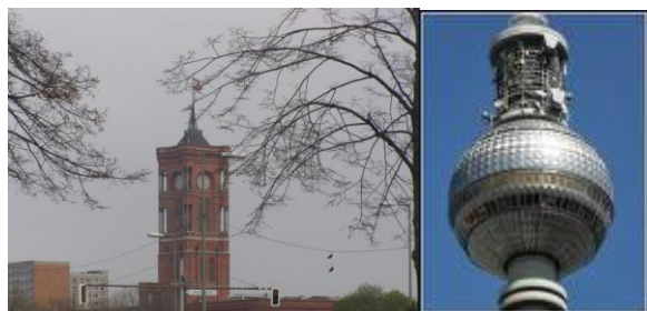
4) Czerwony Ratusz.