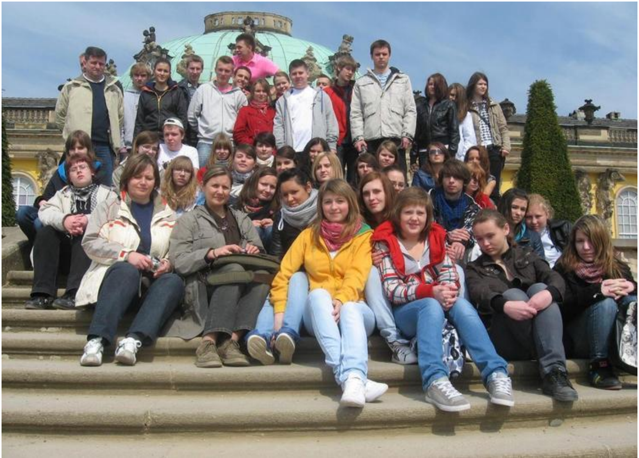
To my w Poczdamie przed Pałacem Sanssouci :)