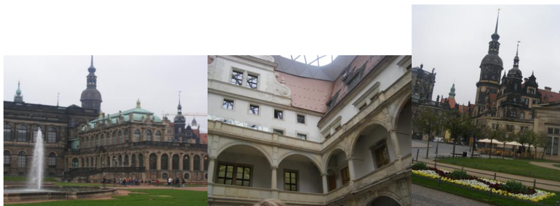
Drezno: Pałac Zwinger, Grünes Gewölbe, Katedra Świętej Trójcy

Z samego rana po posiłku spakowaliśmy się i wsiadając do autokaru, opuściliśmy Berlin, po drodze mijając jeszcze Dom Kultur Świata (w kształcie ostrygi), Dzwonnicę, Kolumnę zwycięstwa i Pomnik żołnierzy radzieckich. O ile do tej pory towarzyszyła nam świetna pogoda, o tyle w Dreźnie dopadł nas deszcz. Nie przeszkodziło nam to jednak w zwiedzaniu Residenzschloss, Katedry Świętej Trójcy (Hofkirche), Opery Seperoper, Pałacu Zwinger i skarbcza Grünes Gewölbe. Trzeba dodać, że zwiedzanie skarbcza odbyło się w językach obcych, gdzie do wyboru były języki niemiecki i angielski. W skarbcu mieliśmy okazję zwiedzić takie sale jak Sala Kości Słoniowej, Gabinet Bursztynów czy Sala Klejnotów. Mimo, że podczas zwiedzania nie zrozumieliśmy wszystkiego, było to genialne doświadczenie. W drodze do autokaru widzieliśmy jeszcze wiele pięknych dzieł architektury renesansu.