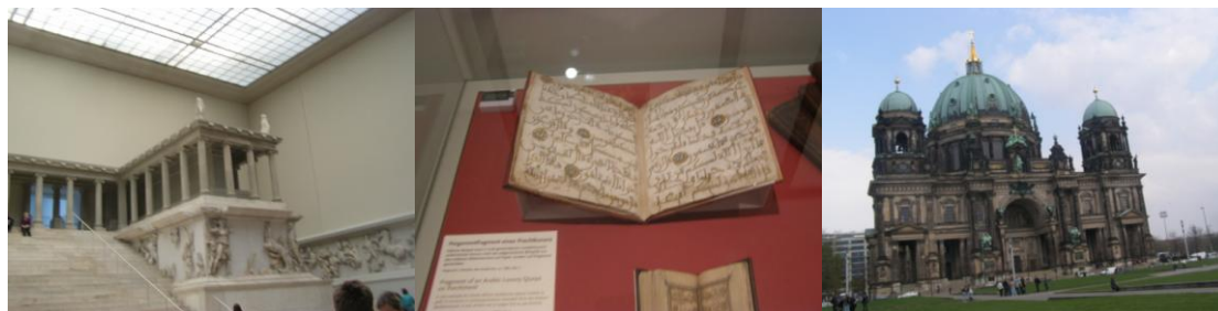
1) Muzeum Pergamonu.